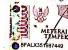
Muhammad Akbar Al Ghozy